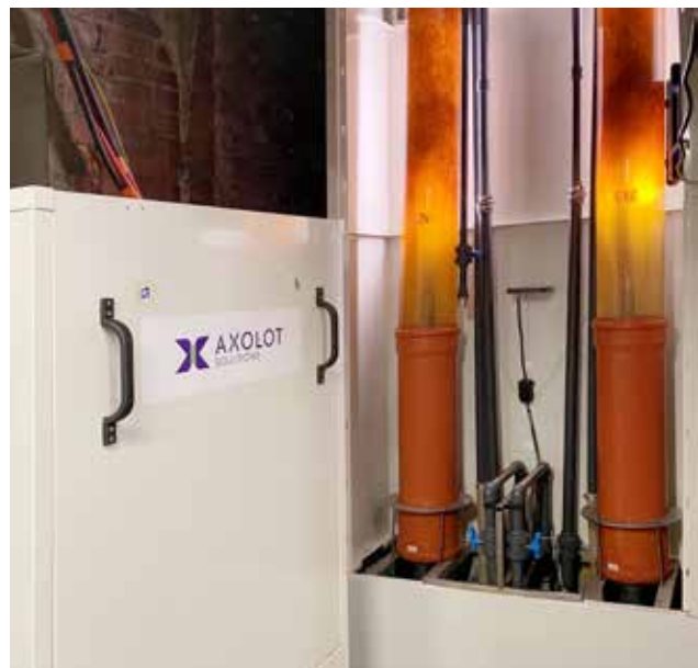
AxoPur-anläggning i reguljär drift.