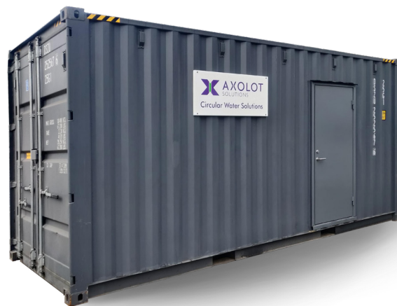
Standardanläggningar säljs i form av nyckelfärdiga system, som kan monteras i containers.