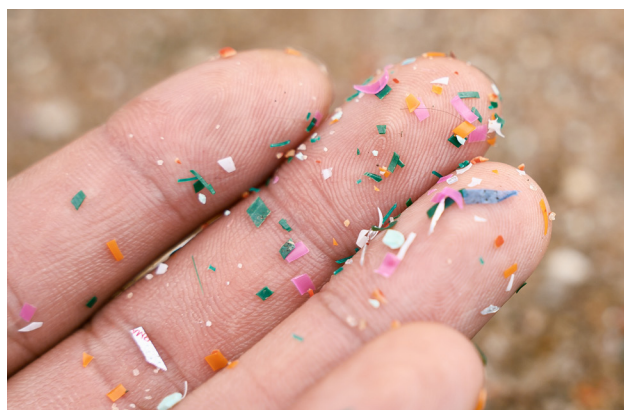
I oktober undertecknades ett signifikant utökat orderomfång på leveransen till plaståtervinningsföretaget Omni Polymers.

koagulation och fällningsreaktion. Genom att integrera den patenterade tekniken i bolagets AxoPur system så breddas möjligheterna att rena olika typer av avlopps- och spillvatten ytterligare.