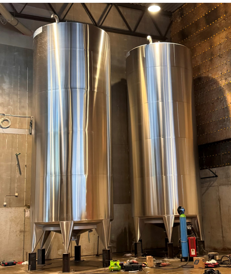
Lossning och installation av bufferttankar för orenat processvatten.