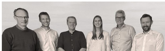
Bild från avtalssigneringen mellan Axolot och MMC First Process.